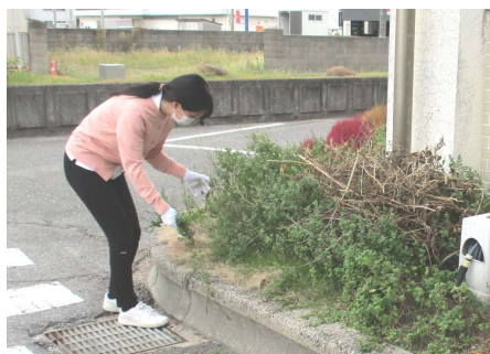
<くめばるの会主催の清掃活動>

10月15日～11月2日の期間、利用者さんと一緒に過ごした川崎医療福祉大学の実習生さんから皆さんにご挨拶が届きました。